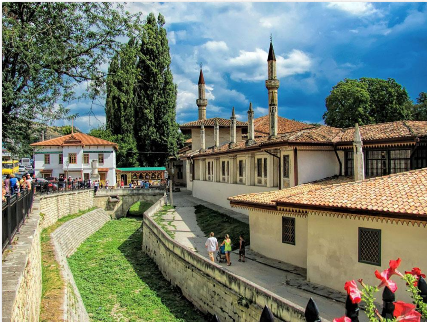
Крым. Ханский дворец в Бахчисарае – исторический памятник крымско-татарского народа