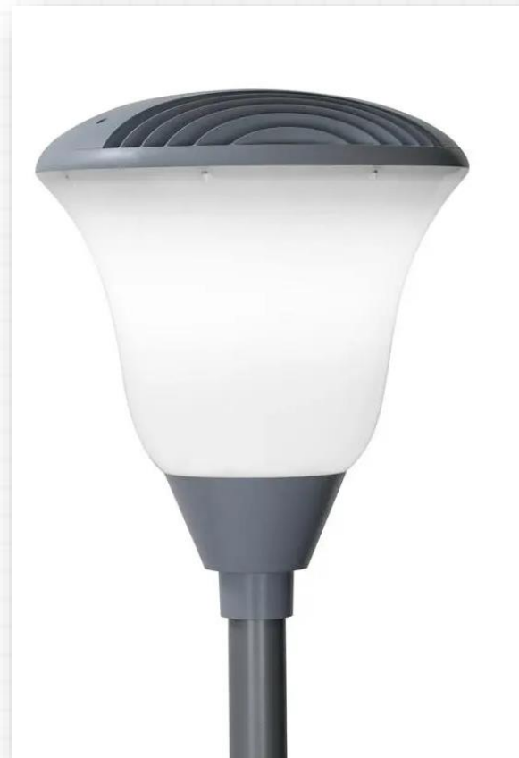
Светильник "Тюльпан" LED-60

А это тюльпаны . Природа подарила им не только яркий цвет, но и выразительную форму . Вот и придумал Мастер Постройки светильник, похожий на этот цветок.