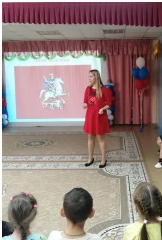
Досуг «День Москвы»