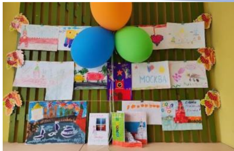
Открытки «С Днем рождения, моя Москва!»