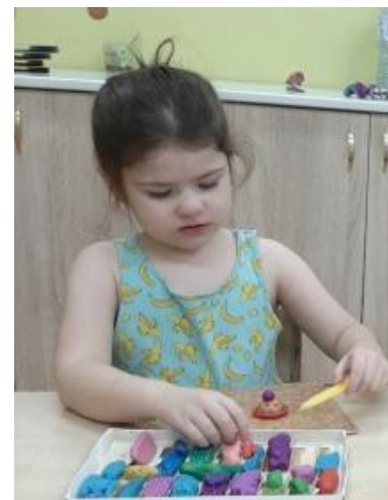
Лепка «мебели, головных уборов»