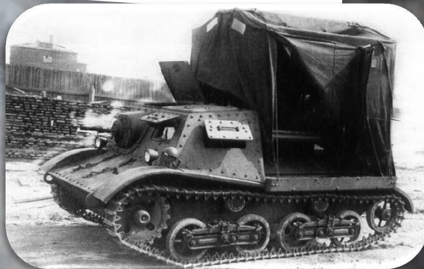
Артиллерийский тягач Т-20