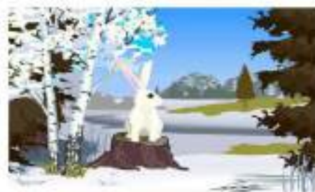
Снег и заяц