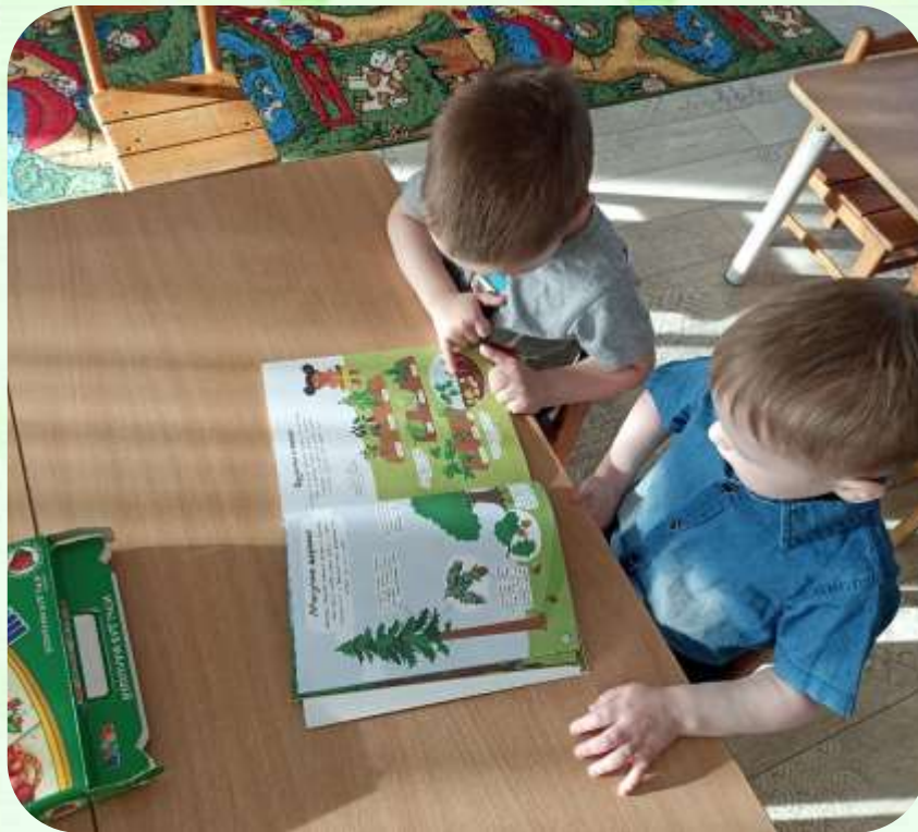
Рассматривание иллюстрации «Что растет в огороде»