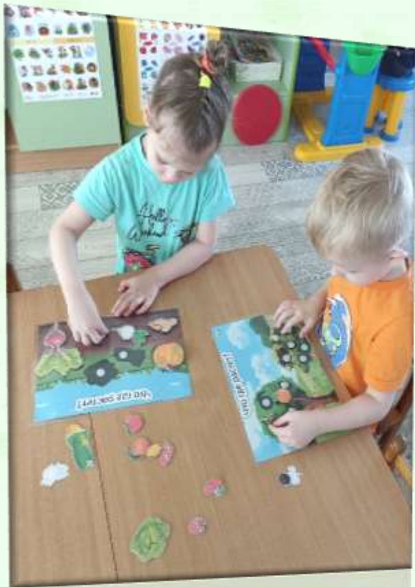
ДИ «Что где растёт»