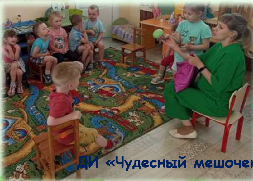
ДИ «Чудесный мешочек»