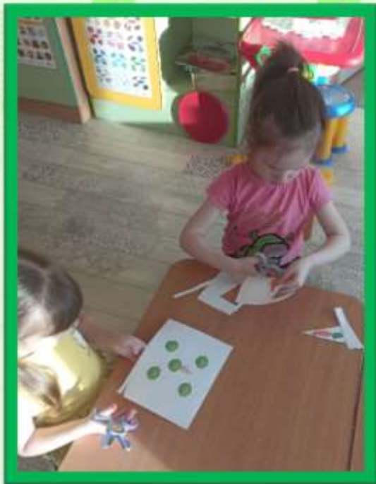
Вырезание по шаблону