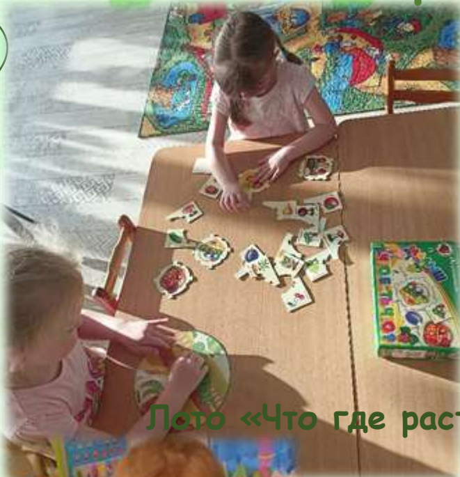
Лото «Что где растёт»