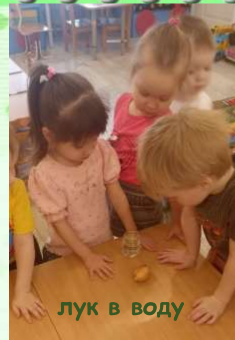
лук в воду