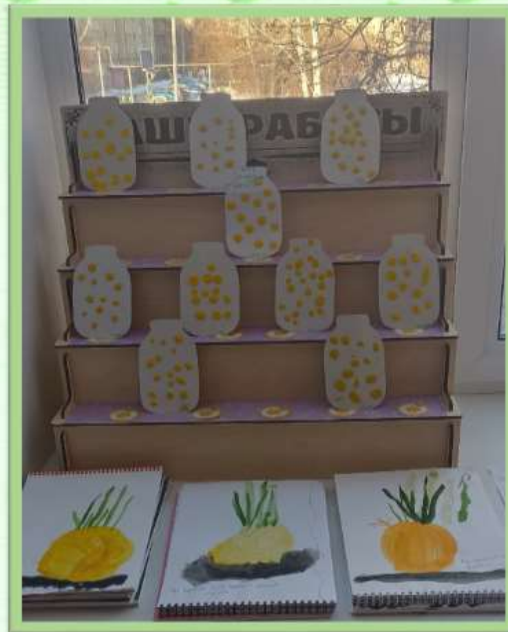
Рисование «Ешьте лук, будете здоровы» Лепка «Витамины в банке»