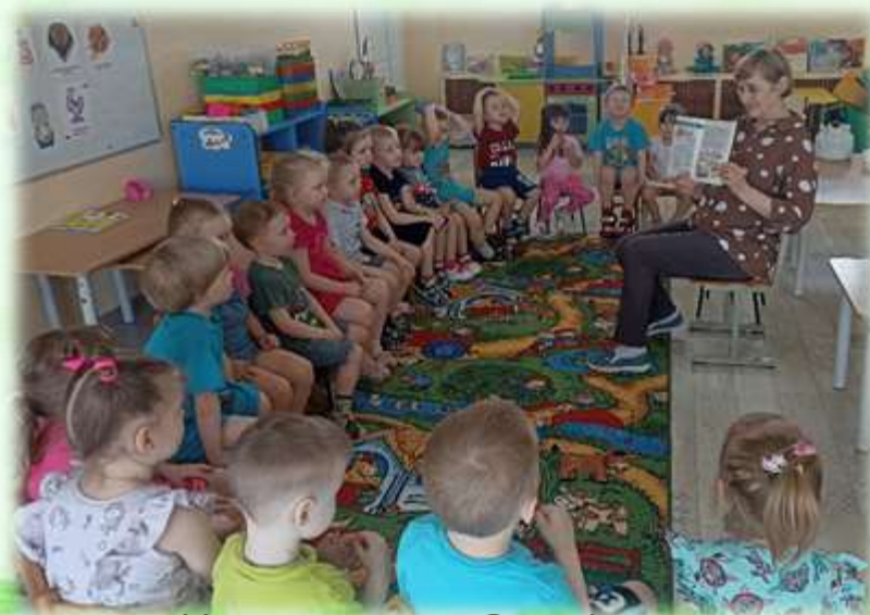
Чтение: С.В. Михалкова «Овощи».