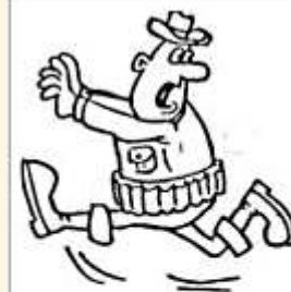
10. Погоня (преследование)