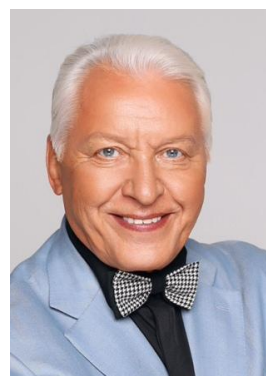
Александр Сергеевич Морозов, композитор