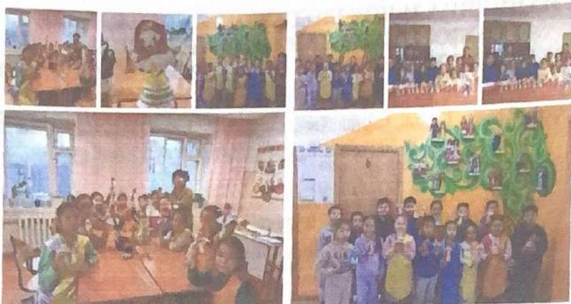
Классный час по теме «Моя родина»

Цели: воспитывать любовь к своей малой родине, уважение к ее истории, культуре, традициям.