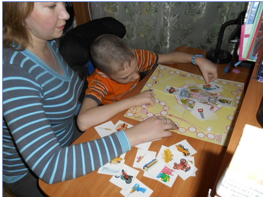
Настольная игра «В городе» на классификацию предметов по группам