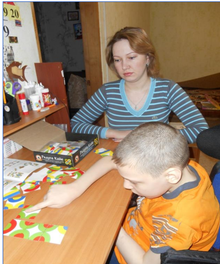
Развивающая предметно-игровая система. Настольная игра с карточками. Радуга Кайе