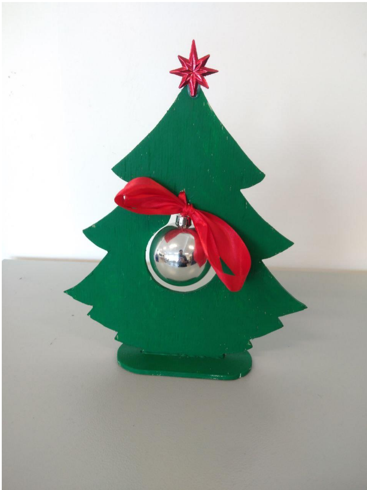
Рисунок 1 Интерьерная новогодняя елочка