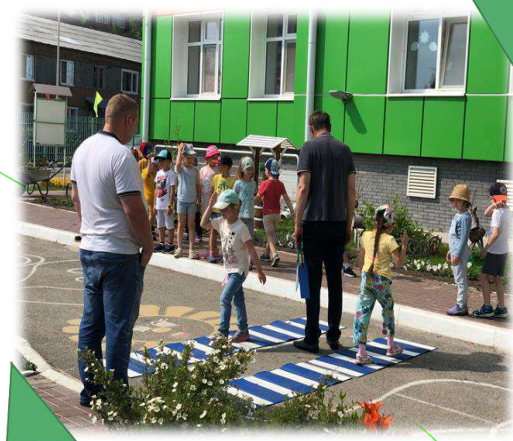
«Дорожная азбука» С представителями Межшкольного Учебного Комбината