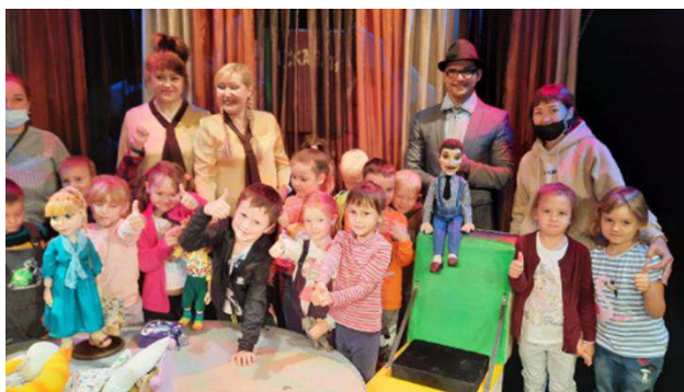
Ходили в Ханты-Мансийский театр кукол Спектакль “ПапаМучительна-папамУчительная сказка”