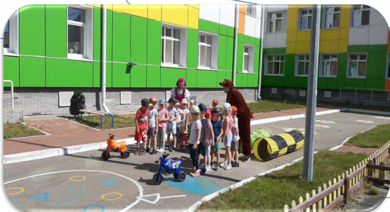
Игры по ПДД на свежем воздухе