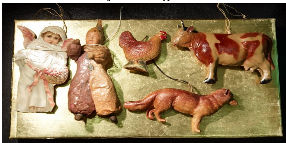
Фотографии – Первые ёлочные игрушки