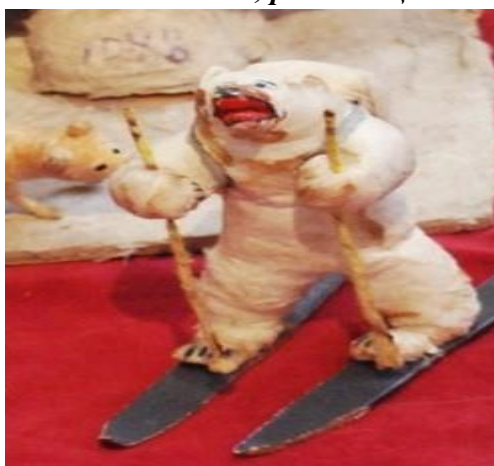
Немецкие игрушки «Дрезденские игрушки»