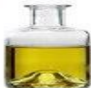
12 ОЛИВКОВОЕ МАСЛО