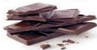
11 ЧЕРНЫЙ ШОКОЛАД