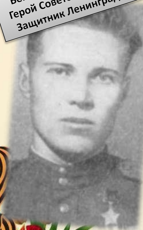
НЕДОШИВИН Вениамин Георгиевич. Герой Советского Союза. Защитник Ленинграда.