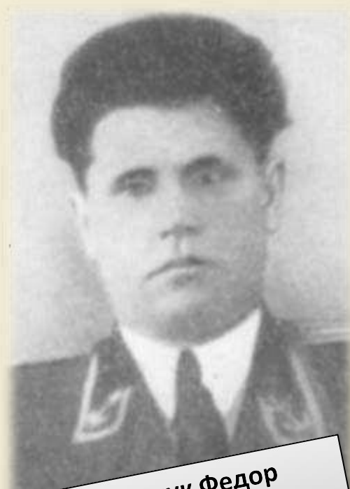
Пахальчук Федор Ефремович Герой Советского Союза, капитан 3го ранга Балтийского ранга