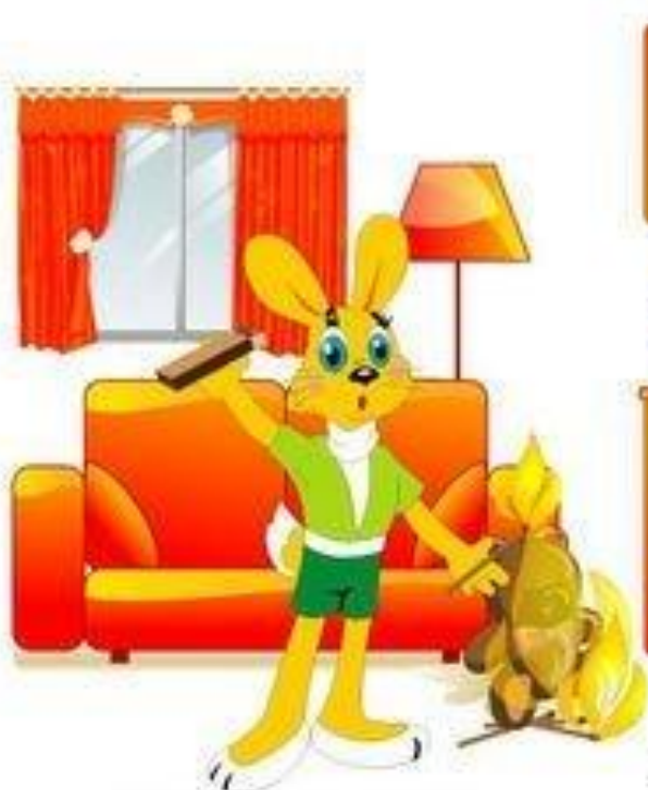
НЕОСТОРОЖНОЕ ОБРАЩЕНИЕ С ОГНЁМ