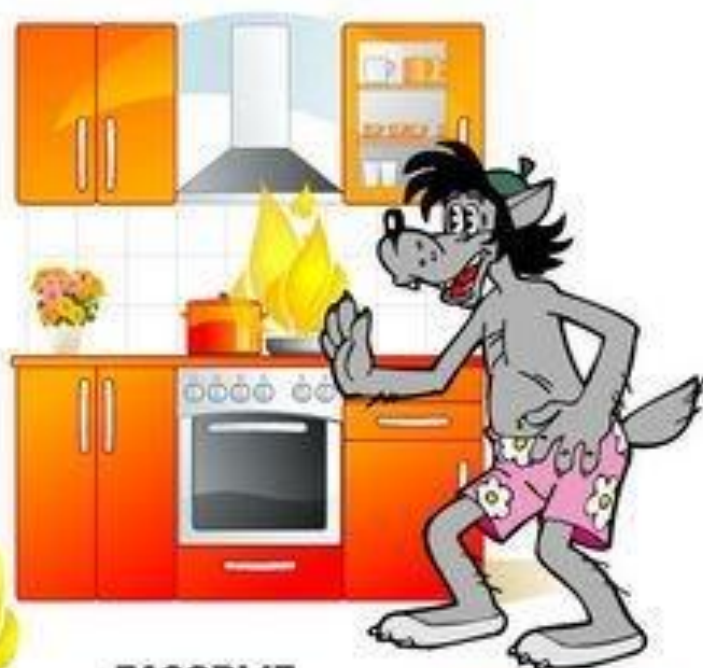
ГАЗОВЫЕ И ЭЛЕКТРИЧЕСКИЕ ПЕЧИ