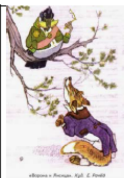
«Ворон и Лисица». Илл. Е. Родд