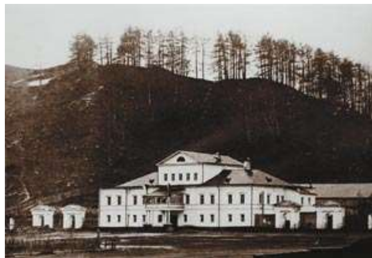
Дом, в котором жил Аносов Павел Петрович в 1831-1847 гг.