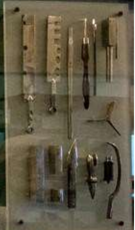
Оружие, изготовленное в Златоусте, 1812-1813 гг. Златоуст, Челябинская область.

Handwritten text on a piece of paper, likely a historical document or letter.