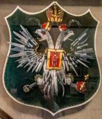
Оружие, изготовленное в Златоусте, 1812-1813 гг. Златоуст, Челябинская область. Оружие, изготовленное в Златоусте, 1812-1813 гг. Златоуст, Челябинская область. Оружие, изготовленное в Златоусте, 1812-1813 гг. Златоуст, Челябинская область.

В 1812 году в городе Златоусте (ныне Челябинская область) был основан завод, который стал центром производства оружия. В Златоусте находилась фабрика, которая производила оружие для армии. В Златоусте находилась фабрика, которая производила оружие для армии. В Златоусте находилась фабрика, которая производила оружие для армии.