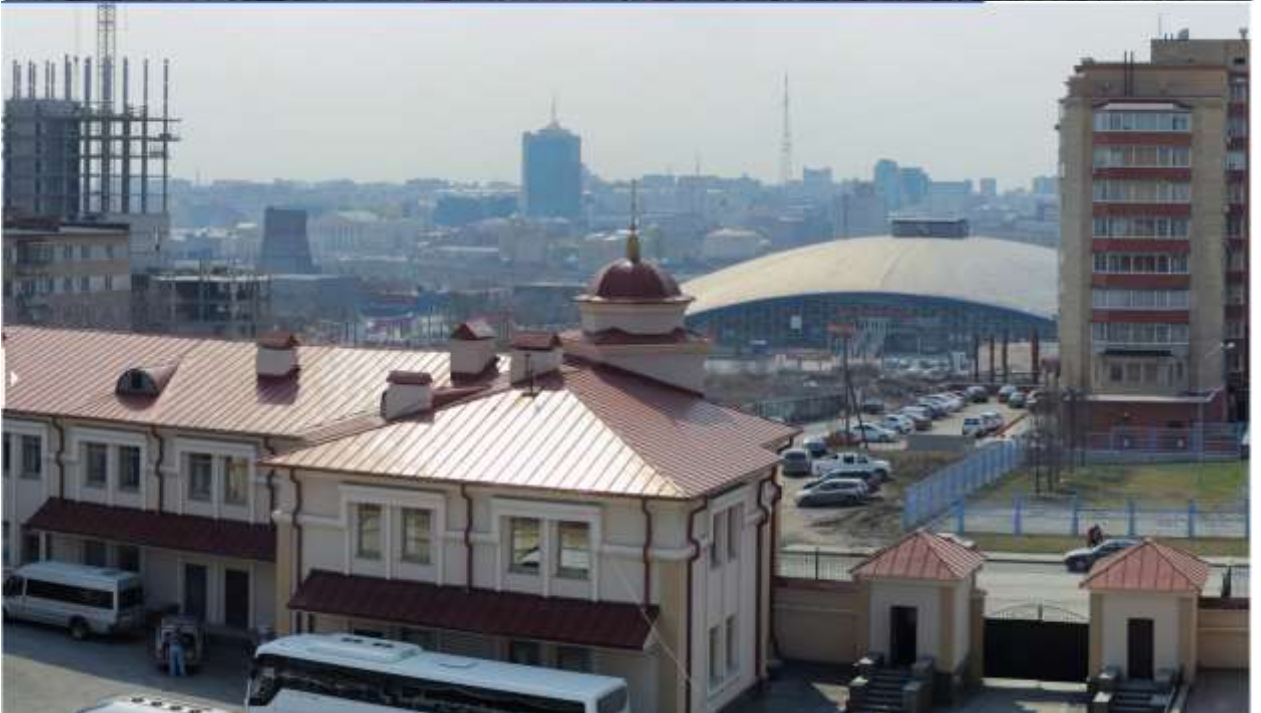
Панорама с севера

Важной составляющей жизни Челябинска была (и остается) река Миасс. Собственно, на реке в 1736 году и была поставлена Челябинская крепость. У реки была и еще одна роль — она делила Челябинск на две части, которые издавна называются «город», или «центр», и «заречье». «Городом» традиционно именовалась правобережная часть, «заречьем» — левобережная, заселявшаяся с 1740-х годов. Заречье соединялось с «городом» мостом — предшественником нынешнего Кировского. В 1768 году в заречье была освящена церковь в честь Святой Троицы. В начале XX века возведена новая Свято-Троицкая церковь, какой мы привыкли ее видеть сегодня. К западу от заречной части, на горке, в середине XIX века организовано православное кладбище, где в 1870-е годы построили Свято-Симеоновскую церковь. Именно с колокольни этой церкви в начале XX столетия и была сделана фотография с панорамным видом Челябинска. На ней видна застройка заречья и южная часть города с ее особняками и многочисленными храмами.