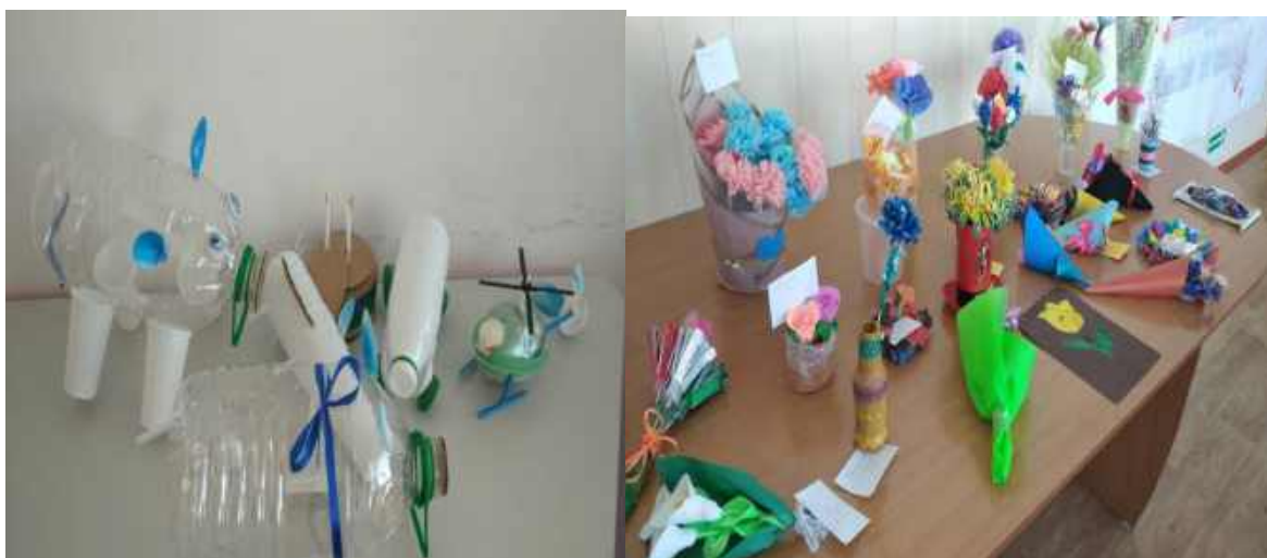
«Мастер - класс от школьников по изготовлению различных моделей»