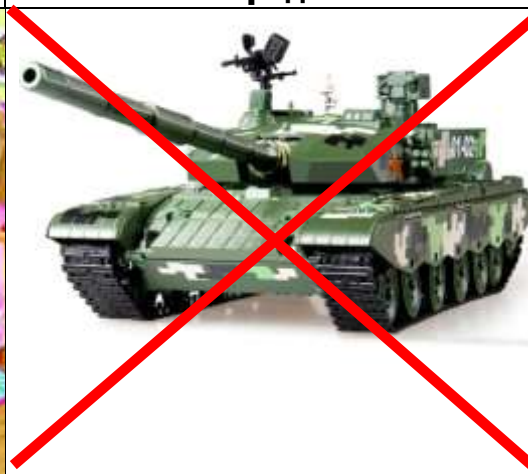
А война пусть выйдет вон!