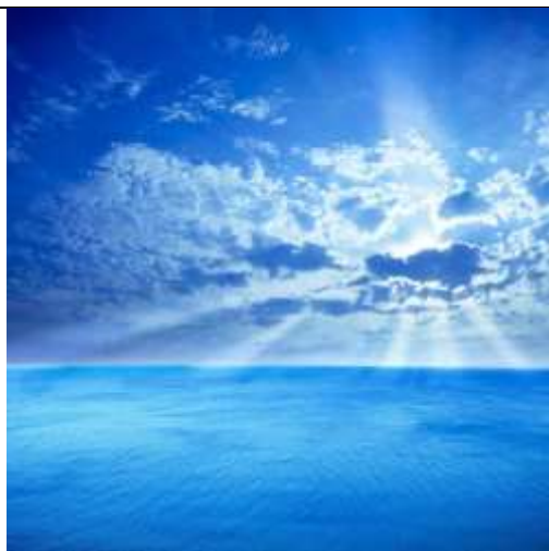
воздух и вода!